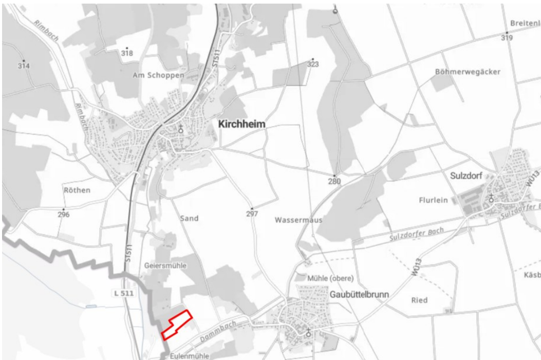
Abb. Übersicht Lage des Vorhabens ohne Maßstab

Der Geltungsbereich des vorhabenbezogenen Bebauungsplanes umfasst die Flurstücke Fl.Nrn. 3034 (Teilfläche), 3035, 3036, 3037, 3038, 3044, 3045, 3046, 3047, 3048, 3053 (Teilfläche), 3059, 3060, alle Gemarkung Gaubüttelbrunn, in der Gemeinde Kirchheim (Ufr.), Landkreis Würzburg. Insgesamt umfasst der Geltungsbereich etwa 2,83 ha.