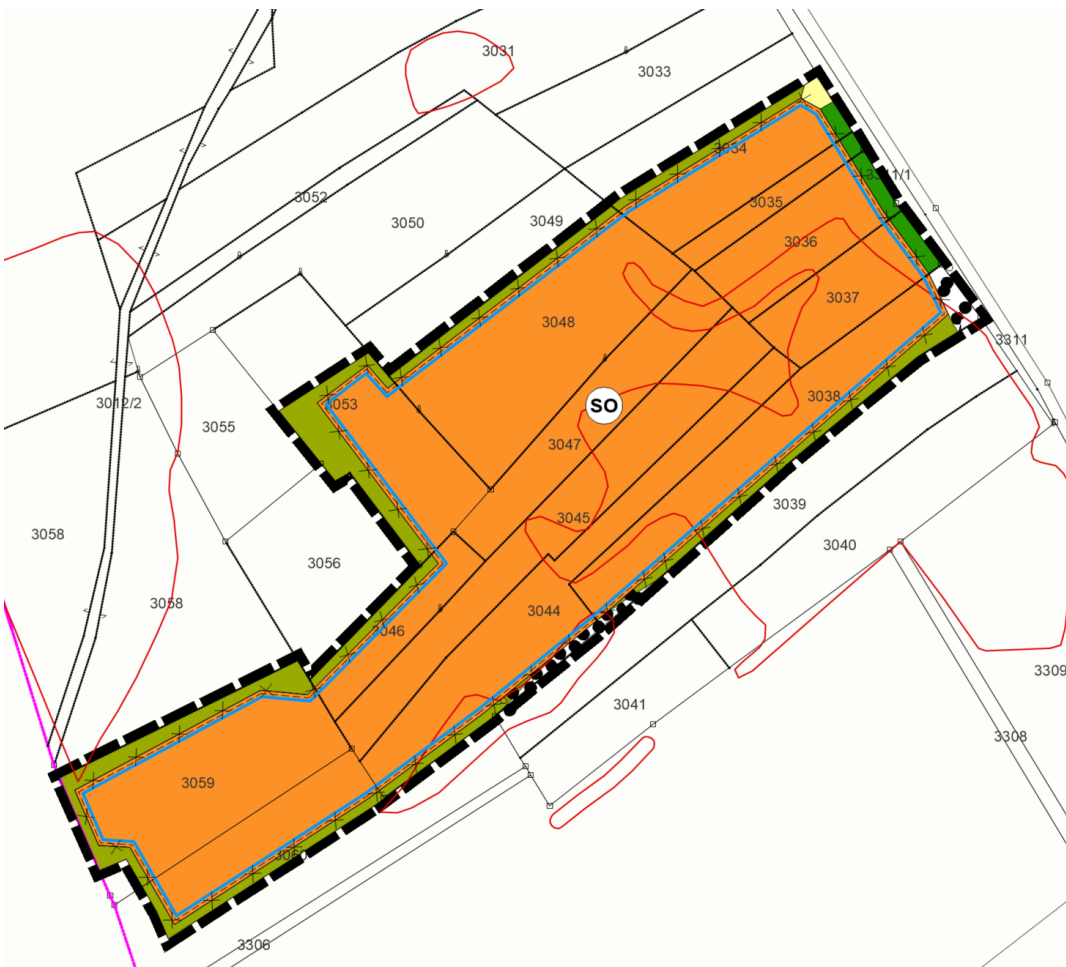
Abb. Darstellung des Vorhabens (ohne Maßstab)